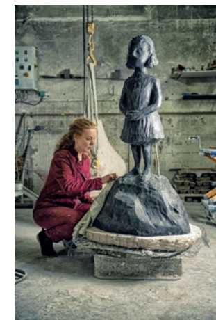
© Adago, Paris 2021 © Photo Hervé Plumet