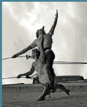
© Alice Casarosa (les amants du ciel)

Retrouvez prochainement le programme complet des Journées Européennes du Patrimoine dans une brochure dédiée.